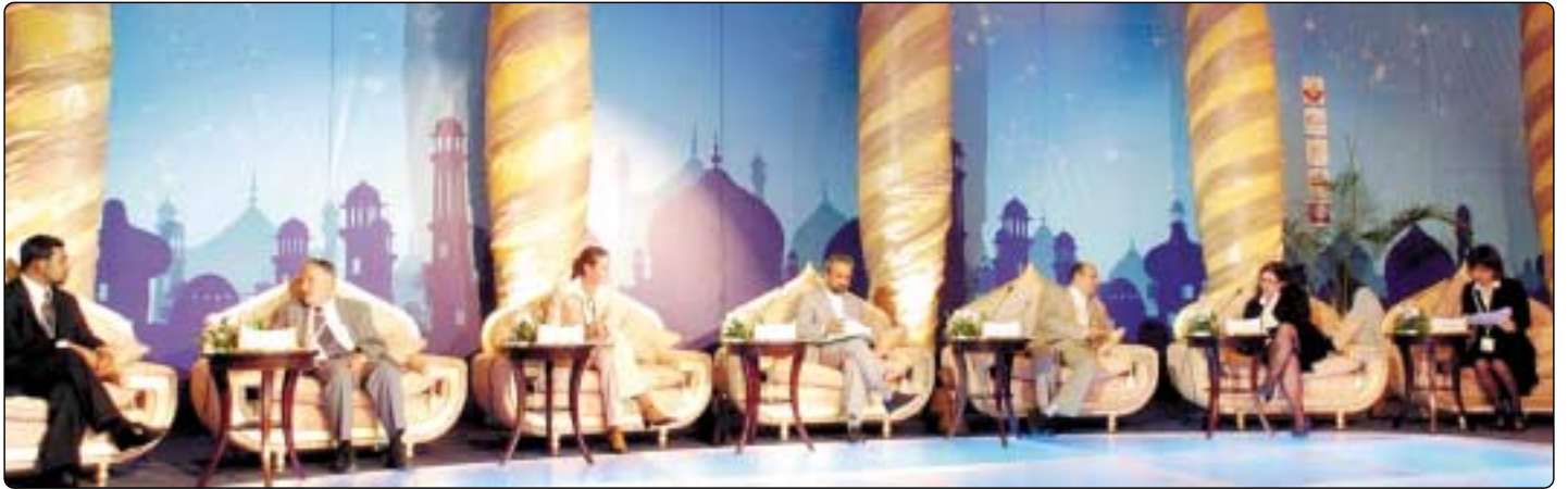
المتحدثون في الجلسة

الرقعة ٨ ربيع الآخر ١٤٢٨ هـ ٢٥ أبريل ٢٠٠٧ م - العدد (٩١١٨)