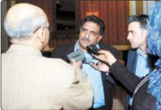
الدكتور عزمي بشارة في تصريحات صحفية

العربية مقبولة، وحول مبادرة السلام قال ان الوقت الذي نسي فيه العرب مبادرتهم ودعوا باتجاه خارطة الطريق.. كنت اتحدث عنها يوميا داخل الكنيست وكان العرب يسألونني عما تحدثت فحاشوا بالبادرة، فكيف يتحدثون عنها الآن؟