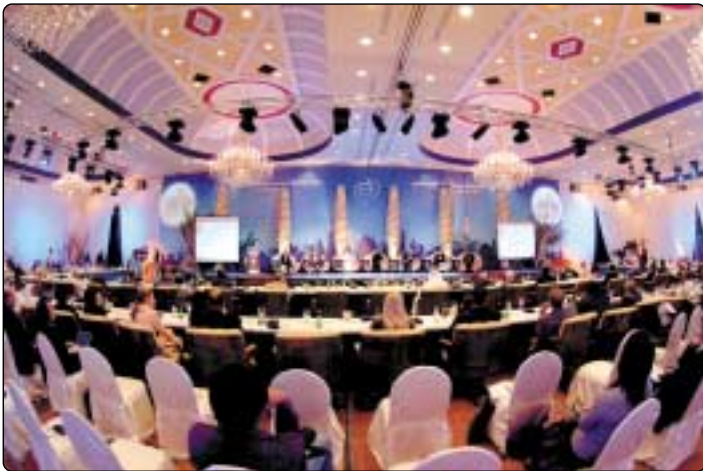
المحتدون قدموا أوراق العمل في الجلسة