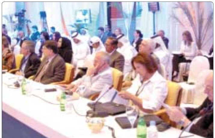
اجنحات ومداوات في الجلسة