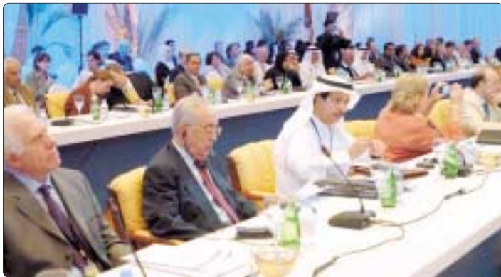
جانب من المشاركين في الجلسة

ثورة التتبع والوجود الحرة للإعلام من الرقابة والمصاولة