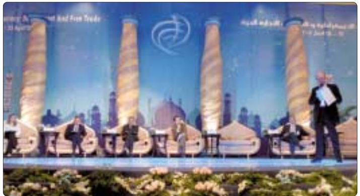
المتحدثون في جلسة الإعلاميين

ثقافتهم وجسدياتهم وقال هناك ضغط يمارس على حرية الإعلام في أمريكا نفسها إلى درجة ان العديد من افنارة الجزيرة المشهود لها بالنزاهة الإعلامية والحرية المطلقة هي قناة معادية للرئيس الأمريكي بوش فهذه القناة بما فطر على ترعها لمكوبي اعصار كاترينا وقالت ان فطر كانت أبرز الدور التي ساعدت على توفير الرعاية الطبية والصحية والتعليم للأطفال وهذا موقف يستحق الشكر والتقدير. وقالت ان جودة الديمقراطية مستمدة من جودة الصحافة والإعلام في تقديره هو الذي يحدد المبادئ، ويضع المتتبعين أمام المبادئ، وفي الخليج على سبيل المثال كم هائل من الشباب ربما ٧٠٪ من السكان أقل من عمر الثلاثين عاماً وهذا الأمر ينسحب على الشرق الأوسط إذ يمكن عقد حوار عبر وسائل التكنولوجيا محلية والقطر القليلة تتابع أخباراً في ذلك المجتمع على الصحف المحلية وفي روسيا الروس لا يتحدثون إلا عن الخبر الروسي وهكذا. وطرح سؤالاً قال فيه ما دور هو وسائل الإعلام على المرء في ظل متغيرات التدفق المعلوماتي