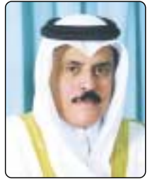
عبد الرحمن العطية

الدوحة - لقاء: وصف سعادة السيد عبد الرحمن بن حمد العطية الأمين العام لجلس التعاون لدول الخليج العربية الخطاب الذي افتتح به حضرة صاحب السمو الشيخ حمد بن خليفة آل ثاني أمير البلاد المفدى منتدى الدوحة السابع للديموقراطية والتنمية والتجارة الحرة بانها موفية بالقيم.. منوها بما تضمنه الخطاب من رؤى وافكار مبدئية واضحة تجاه معظم القضايا التي تشغل اهتمام المنطقة.