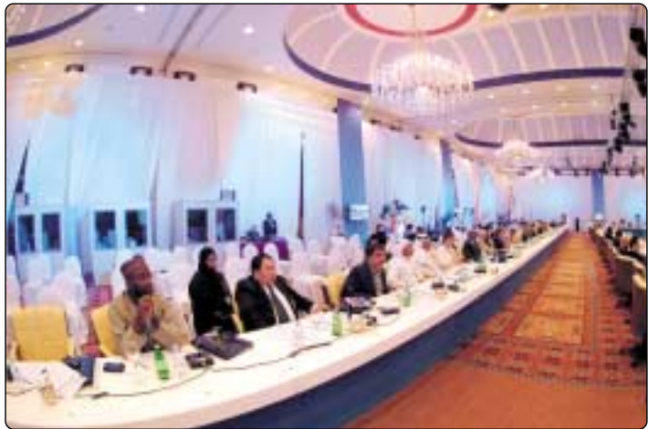
المشاركون في جلسة «صراع الحضارات»