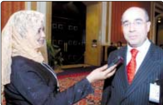
المصري في البحريني فائز عبدالله يتحدث في الدوحة

على عكس ما كان من قبل حيث كانت الاحكام العرفية والعسكرية تحد من حرية الانسان في التعبير عن رايه بكل حرية فكان يخرج خارج البلاد لكي يعبر عن رايه بكل صراحة وحرية.. والان تتوفر في البحرين حرية الرأي وهناك مجلس النواب والمارسات الانتخابية.. وأشار الى ان اي مواطن خليجي تتوفر له كافة احتياجاته.. ويعمل المجتمع الخليجي لحل المشاكل.. واتجه لعملية التنمية والبناء الشامل.. وهناك الكثير من الاصلاحات التي شهدت البحرين بعد تولي الملك مقاليد الحكم كما ان رجوع السياسيين دليل على وجود ديمقراطية وحرية رأي.